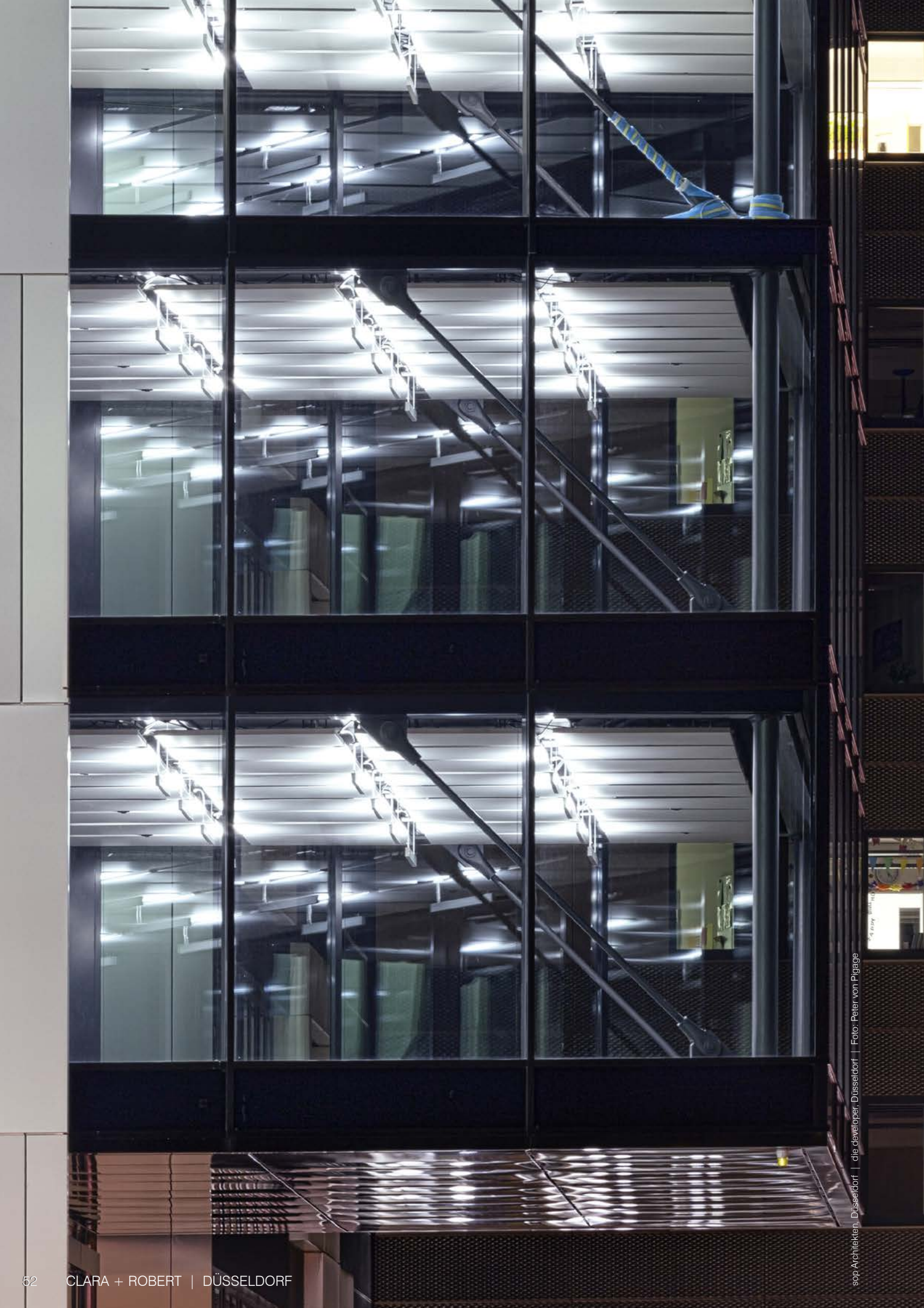
sop Architekten, Düsseldorf | die developer, Düsseldorf